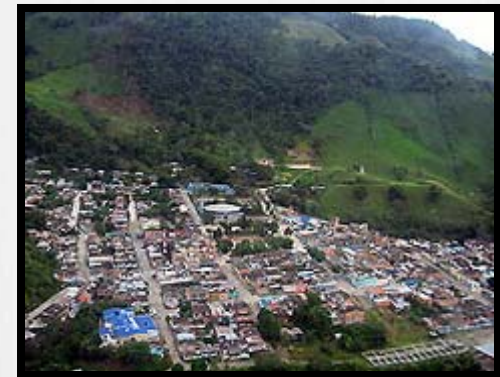
MUNICIPIO DE OTANCHE

Ruta de la Esmeralda: Conformada por los municipios de: Chiquinquirá, Pauna, San Pablo De Borbur, Santa Bárbara y Otanche Ubicados en el departamento de Boyacá. El evento se realizará en el parque principal de Otanche